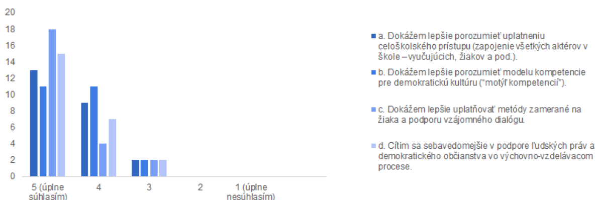
Graf 2 Sebahodnotenie účastníkov a účastníčok

dôveru účastníkov, aby vo vzdelávacom procese uplatňovali metódy zamerané na žiaka a podporili vzájomný dialóg; (3) zaviesť a presadzovať najnovšie prístupy a nástroje Rady Európy v oblasti výchovy k demokratickému občianstvu a ľudským právam a podporovať ich používanie vo vzdelávacej praxi; (4) reflektovať Referenčný rámec kompetencií pre demokratickú kultúru a zvýšiť povedomie o tom, ako ho integrovať do vyučovacieho procesu v škole. Z hodnotiacej správy školiteľov vyplýva, že všetky hlavné plánované vzdelávacie ciele sa podarilo naplniť. Jednoduché sebahodnotenie účastníkov a účastníčok, ako naplnili vyššie uvedené ciele, predstavuje nasledujúci graf.